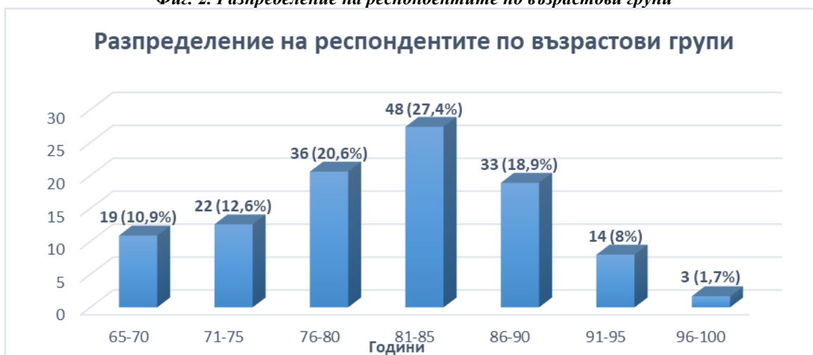
Фиг. 2. Разпределение на респондентите по възрастови групи

Институционалната грижа включва задоволяване на основните социално-медицински потребности на ползвателите. Сред тях са: хранене, обличане, поддържане на личната хигиена и на тази на обитаемите помещения, отопление, медицинско наблюдение, осигуряване на достъп до здравни грижи, планиране на свободното време на обитателите с подходящи за състоянието и възможностите им занимания (Йоргова М., Пулова Ю. и Милева С., 2016). Лицата от по-големите възрастови групи се категоризират като такива с най-значителни увреждания. Те се нуждаят от предоставяне на по-обширна помощ при хранене, преместване, поддържане на личната хигиена, осигуряване на мобилност (Lee S. J., Kim M. S., Jung Y. J., & Chang S. O., 2019). Направеното проучване установи, че малко от лицата се сблъскват с трудности по време на престоя в институцията (14%). Повечето (86%) не срещат затруднения при пребиваването си в ДСХ (фиг. 3). Най-често затрудненията са свързани с пренебрегване на нуждите им от почистване след ходене до тоалетна, отказ за оказване на медицинска помощ, отказ на помощ за придвижване, хранене, преобличане, почистване на стаята, отказ за общуване при желание от страна на възрастния човек.