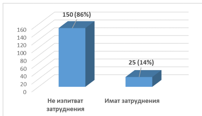
Фиг. 3 Разпределение на респондентите в зависимост от наличието на затруднения, съпътстващи престоя им в ДСХ

Според респондентите, в ДСХ се полагат достатъчно грижи, което значително ограничава трудностите им. Много често възрастният човек е уязвим в редица отношения. От една страна постепенното и прогресивно влошаващо се здравословно състояние, а от друга промяната в емоционалното състояние. Поради спецификата на потребностите в старческа възраст, е необходимо да се създаде подходяща среда за достойно преживяване на остатъка от живота.