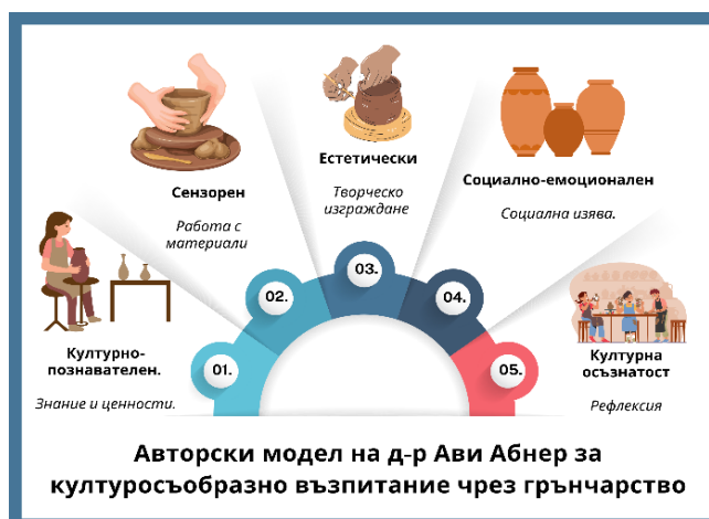
Фигура 1. Модел за културосъобразно възпитание чрез грънчарство

Източник: Фигурата е авторска, създаден от д-р Ави Абнер