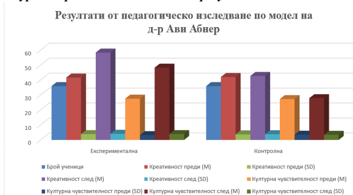
Фигура 3. Сравнителен анализ на резултатите от изследването