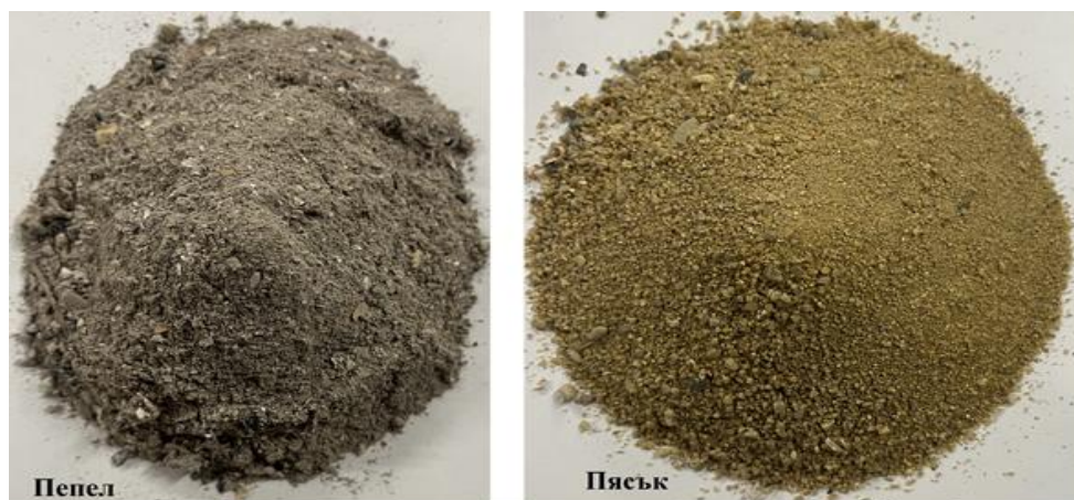
Фиг. 2. Материали, използвани за сепариране