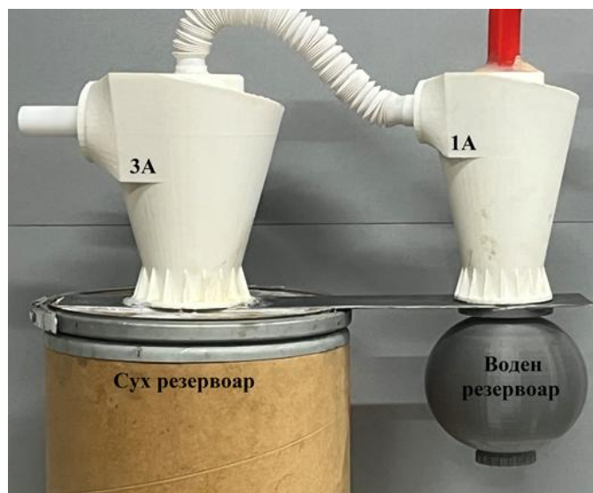
Фиг. 1. Изследвана компоновка

Спецификата на изследваните материали е, че имат много фина структура и са летливи, и най-вече пепелта, и затова инерционният момент в сепаратора не успява да улавя на 100% тези материали и по тази причина са проведени експерименти с последователно свързани циклони, за да се постигне по-голям резултат. Материалите за изследване са показани на фигура 2.