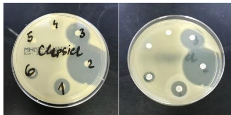
Слика 3. Приказ на ефектот на антисептиците / дезинфициенсите врз соевите на Klebsiella spp.

Врз основа на добиените резултати за Klebsiella spp. може да се заклучи дека истата е најчувствителна на формалдехидот (2) (35 mm), но задоволителен ефект покажале и водородниот пероксид (3) (23 mm) и бензалкониум хлоридот (1) (13 mm). Сепак, бактеријата е резистентна спрема: етанолот (4), борната киселина (5) и повидон јодот (6).