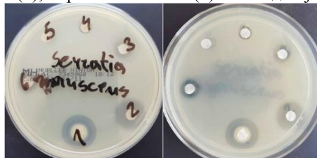
Слика 4. Приказ на ефектот на антисептиците / дезинфициенсите врз соевите на Serratia marcescens

Врз основа на добиените резултати за Serratia marcescens може да се заклучи дека истата е чувствителна на бензалкониум хлоридот (1) (15 mm) и формалдехидот (2) (15 mm). Сепак, бактеријата е резистентна спрема: водородниот пероксид (3), етанолот (4), борната киселина (5) и повидон јодот (6).