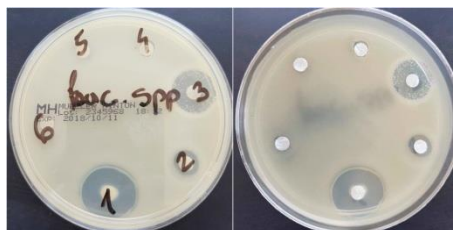
Слика 1. Приказ на ефектот на антисептиците / дезинфициенсите врз соевите на Bacillus spp.

Врз основа на добиените резултати за Bacillus spp. може да се заклучи дека истата е најчувствителна на бензалкониум хлоридот (1) (22 mm), но задоволителен ефект покажал и водородниот пероксид (3) (15 mm). Сепак, бактеријата е резистентна спрема: формалдехидот (2), етанолот (4), борната киселина (5) и повидон јодот (6).