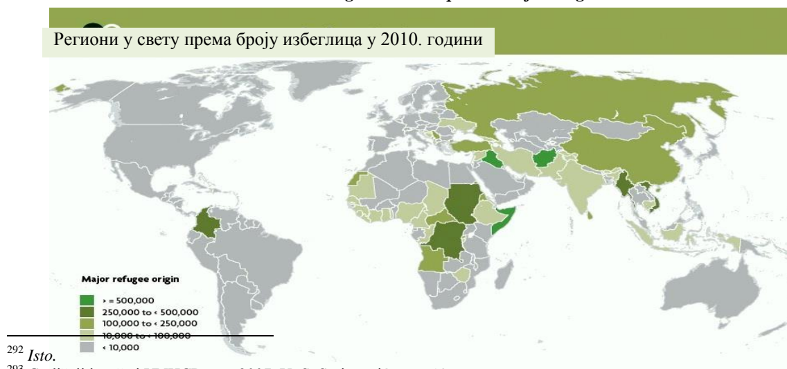
Sl.4.- Regioni u svetu prema broju izbeglica 294

Regioni sa najvećim brojem izbeglica u svetu na kraju 2010. prikazani su na slici 4.