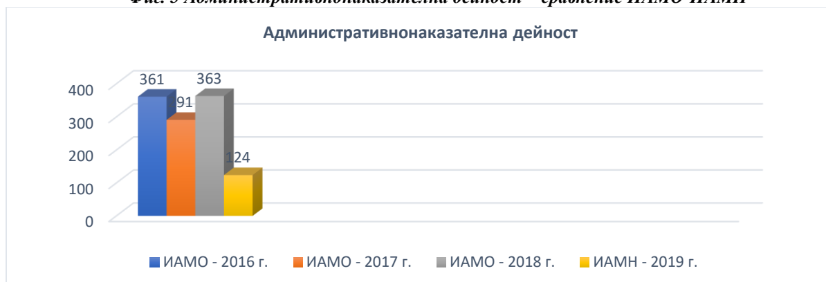
Фиг. 5 Административнонаказателна дейност – сравнение ИАМО-ИАМН

Според Frontiers in Psychology , ефективният надзор осигурява средство за проследяване на резултатите, поощряване на ефективната работа и коригиране на грешките. Постигането на тази цел изисква инспекторите да притежават много знания, умения и инструменти, с помощта на които да провежда адекватни и всеобхватни проверки. Очакваният резултат е това поведение да допринесе за подобряване на качеството на здравните грижи, което съвсем резонно е и целяният ефект на контрола. Следователно, чрез