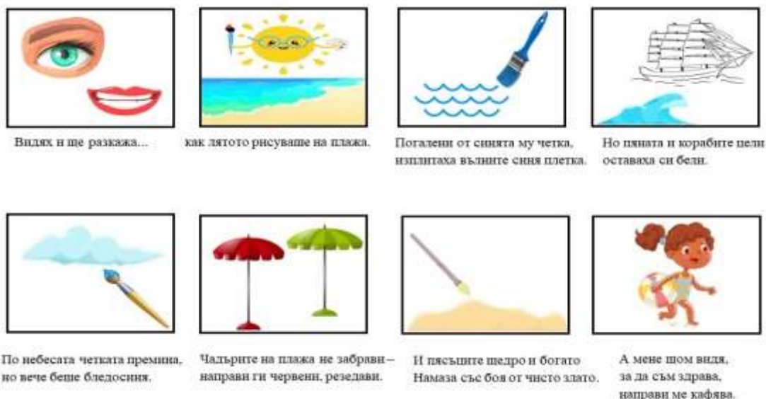
Фигура 1. Мнемотаблица по стихотворението „Лятото рисува“ от Кинка Константинова