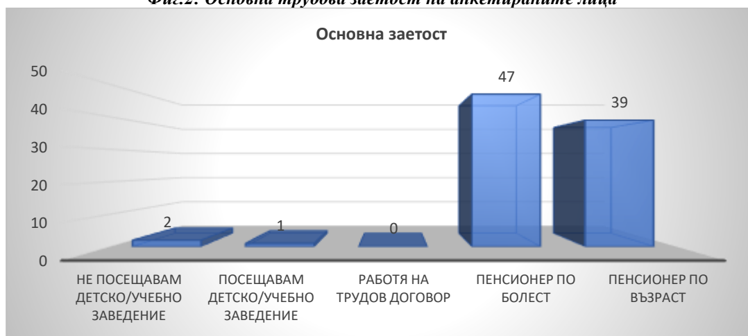
Фиг.2: Основна трудова заетост на анкетираните лица

Опциите за отговор „обезщетение за безработица“ и „трудова възнаграждение“ не са посочени от него едно от анкетираните лица. 29 лица (32,58%) са посочили два отговора - получават пенсия и финансови средства от близки и роднини. Това още веднъж показва, че голяма част от лицата в работоспособна възраст извършват трудова миграция и подпомагат финансово на възрастните си родители.