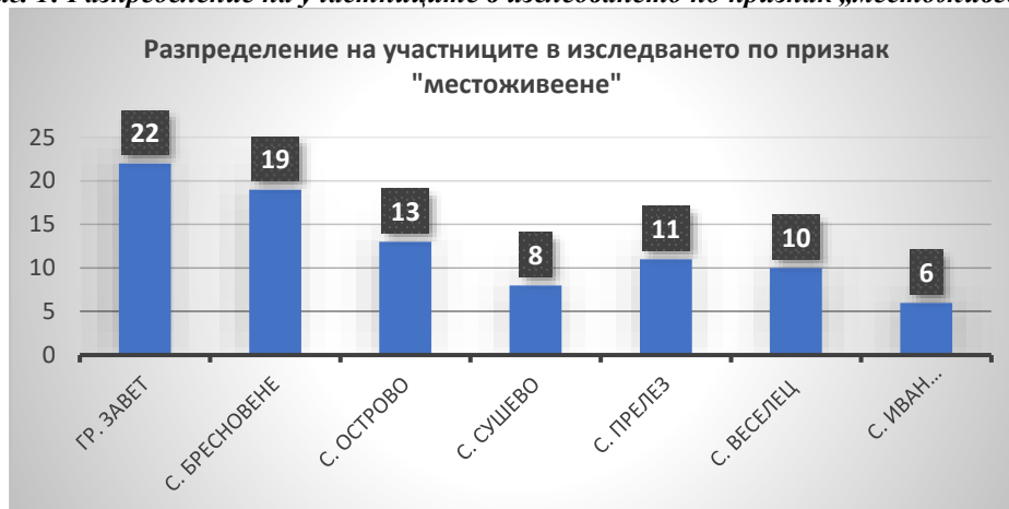
Фиг. 1: Разпределение на участниците в изследването по признак „местоживеене“

От общо 89 лица, жители на община Завет, участвали в изследването 42 лица, които представляват 47,19% от общия брой анкетираните лица посочват, че са лица с установено увреждане и са на възраст до 65 години. 38 лица, които са 42,70% от общия дял посочват, че са на възраст над 65 години, но при тях няма установено увреждане. В анкетата са се включили и 5 лица, които полагат грижи в домашна обстановка за лице с увреждане и 4-ма родители на деца с увреждане.