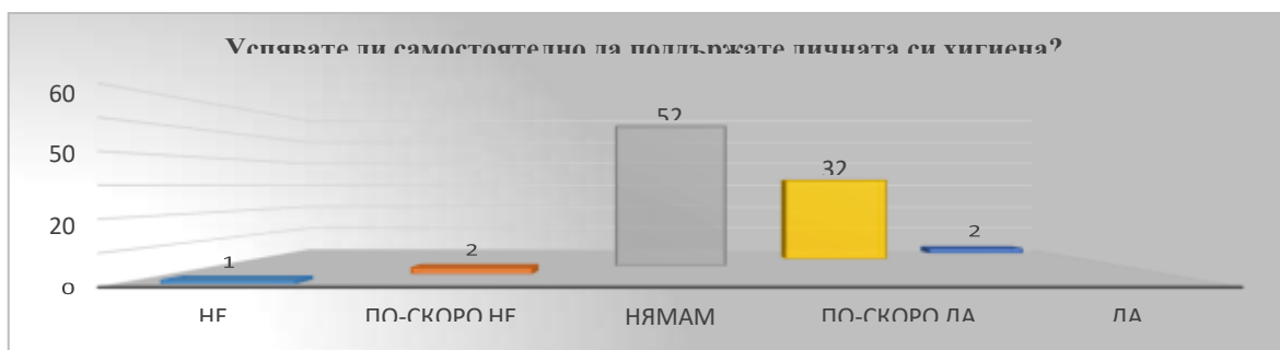
Фиг. 3: Отговори на въпроса „Успявате ли самостоятелно да поддържате личната си хигиена?“

Отговорите показват, че голям брой лица осъзнават и споделят, че не могат сами да поддържат личната си хигиена и за това получават помощ. Смушаващ е броя на лицата, посочили отговор „нямам мнение“ (той е и най-висок). Тълкуването на мотива за посочване на този отговор може да бъде разнопосочен – от невъзможност за поддържане на лична хигиена и срам у изследваните лица да посочат този отговор, до липса на необходимите битови условия за поддържане на хигиена, което е често срещано все още в по-малките населени места. Мнението на авторите е, че населението в община Завет е по-скоро притеснително и не желае да отговори на въпроси от личен характер.