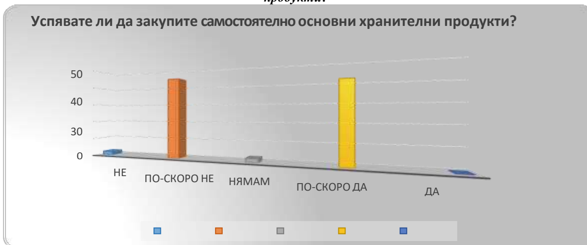
Фиг. 5: Отговори на въпроса „ Успявате ли самостоятелно да закупите основни хранителни продукти?“

С цел установяване на степента на самостоятелност при извършване на основна дейност от ежедневието – закупуване на основни хранителни продукти и приготвяне на храна, в анкетната карта са включени два въпроса. На първия от тях „Успявате ли (вие/лицето, за което полагате грижи) без чужда помощ да си закупите основни хранителни продукти?“ лицата, обект на изследване посочват следните отговори: 44 лица (49,44%) от всички анкетирани посочват, че по-скоро не успяват да си закупят основните хранителни продукти самостоятелно; 41 лица (46,07%) от анкетираните са отговорили, че по-скоро успяват без чужда помощ да си закупят основните хранителни продукти. Отговорите на въпроса са визуализирани чрез диаграма на фигура 5.