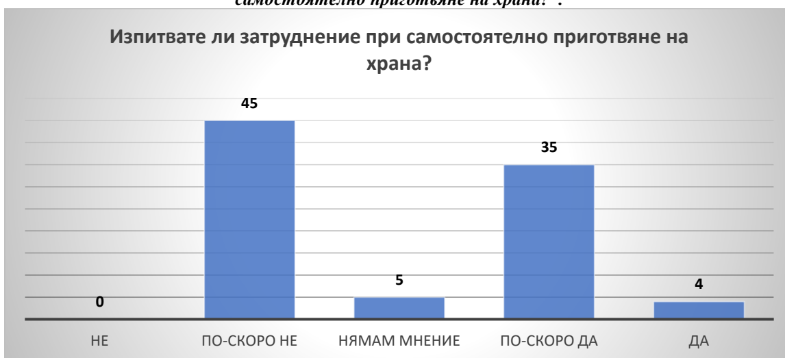
Фиг. 6: Отговори на въпроса „ Вие (лицето, за което полагате грижи) изпитвате ли затруднения при самостоятелно приготвяне на храна? “.

В каква степен изследваните от нас лица успяват самостоятелно да си приготвят храната установяваме със следващия въпрос „ Вие (лицето, за което полагате грижи) изпитвате ли затруднения при самостоятелно приготвяне на храна? “. Получените отговори очертават следната тенденция: 45 лица (50,56%) от общия брой анкетирани по-скоро не изпитват затруднение при самостоятелно приготвяне на храна, 5 лица (5,62%) не споделят мнение, 35 лица (39,33%) от анкетираните споделили, че по-скоро се затрудняват при самостоятелно приготвяне на храна и 4 лица (4,49%) отговарят категорично, че се затрудняват при самостоятелно приготвяне на храна. Отговорите на въпроса са представени чрез диаграма на фигура 6.