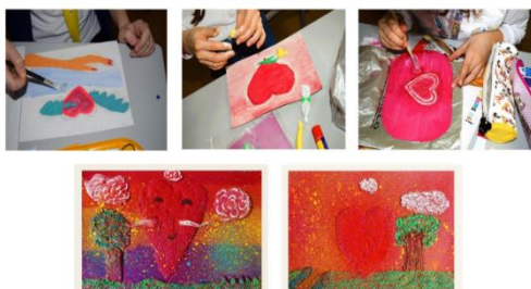
Фигура 2. Работен процес