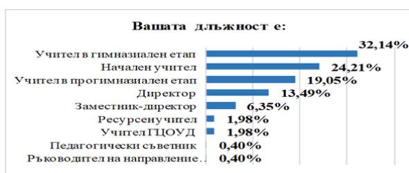
Диаграма 3. Разпределение на респондентите по признак „длъжност“