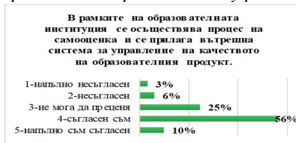
Диаграма 7. Разпределение на отговорите на респондентите по отношение оценката им за „процеса на самооценка и прилагането на вътрешна система за управление на качеството“