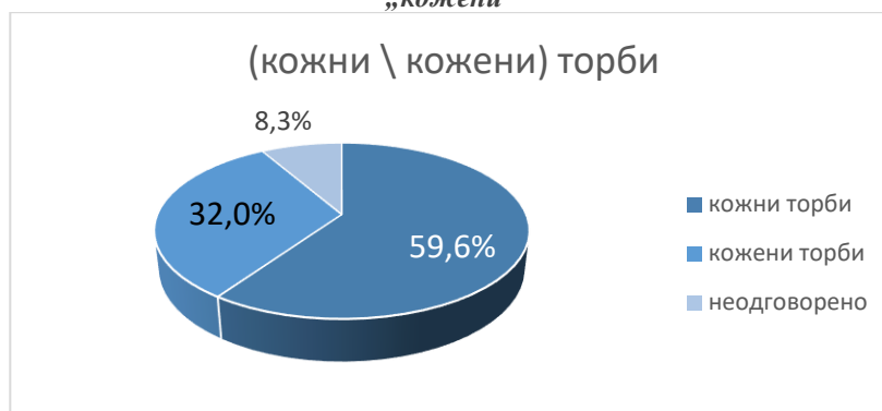
Слика 1. Процентуална застапеност на добиените одговори за паронимскиот пар „кожни“ и „кожени“