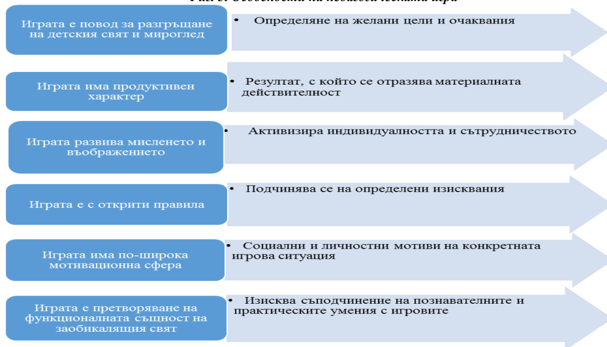
Фиг. 3. Особенности на педагогическата игра