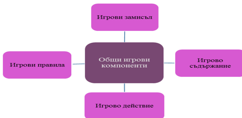
Фиг. 2. Общи игрови компоненти

Замисълът, конкретизиран от темата, изисква решение в игрови план. Те активизират цялостния познавателен и практически потенциал на детето. Съдържанието е съвкупност от моделите и тяхното пространствено разположение, имитиращи жизнената или игрова среда на детето. Игровото действие е реално действие във въображаема ситуация. Игровата ситуация представлява организацията на игровите модели в пространството в зависимост от замисъла на децата, начина на неговото практическо реализиране и перспективата на развитие. Те могат да се изменят във времето и пространството, съобразно нови идеи, умения, отношения и пр. Ще се съсредоточим върху развитието на игровата дейност, която е свързана основно с оформянето на нейната структура и включва точно определени игрови компоненти.